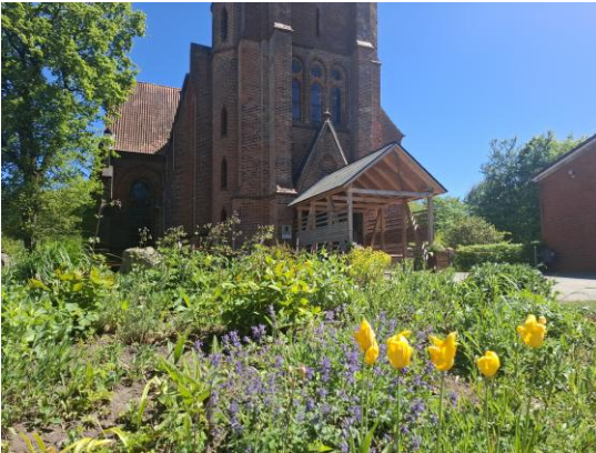
Blühbeet an der Maria-Magdalenen-Kirche

Wie viel schöner ist dagegen ein Garten mit fruchtbarer Erde, heimischen Pflanzen und Tieren oder ein Kiesgarten nach alpinem Vorbild, die durchaus auch pflegeleicht gestaltet werden können!